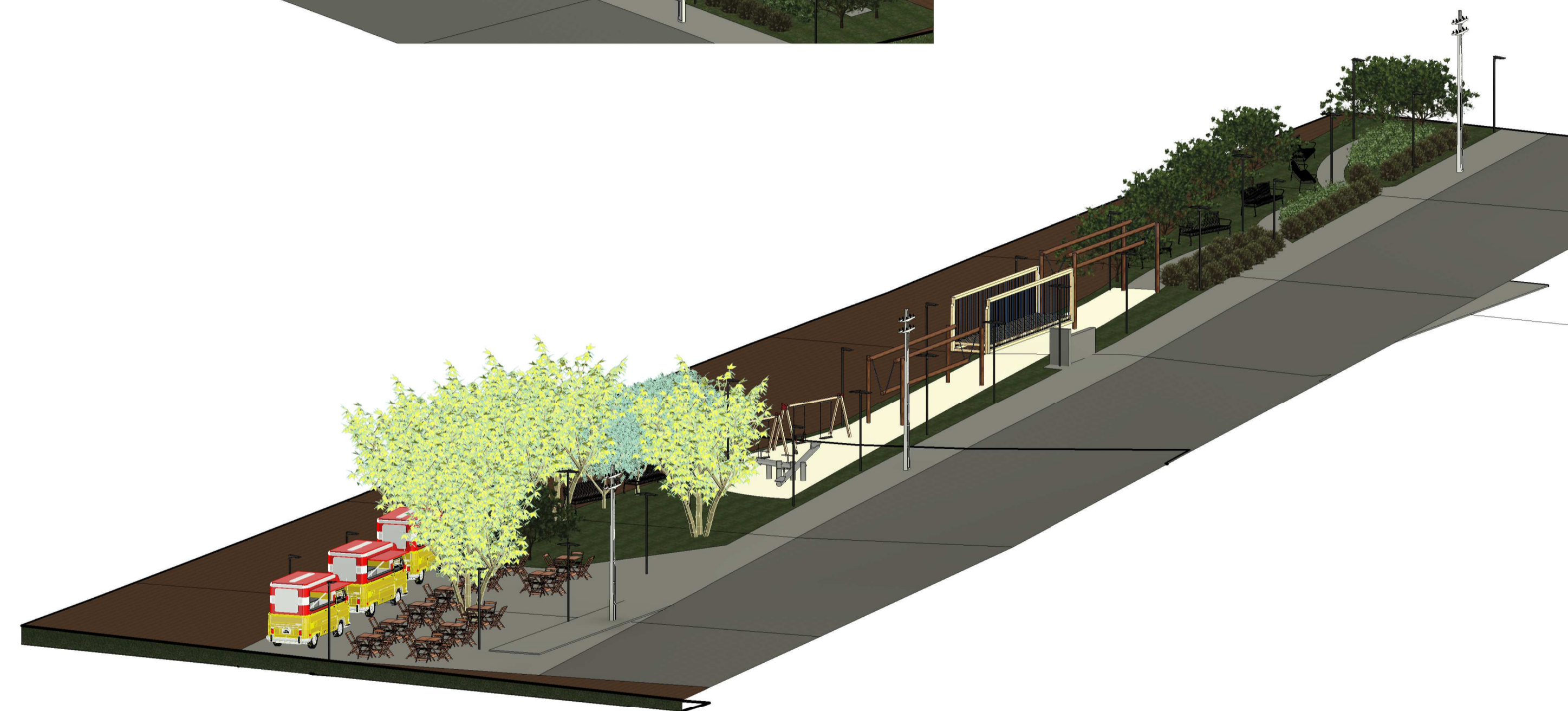
1 Perspectiva 2