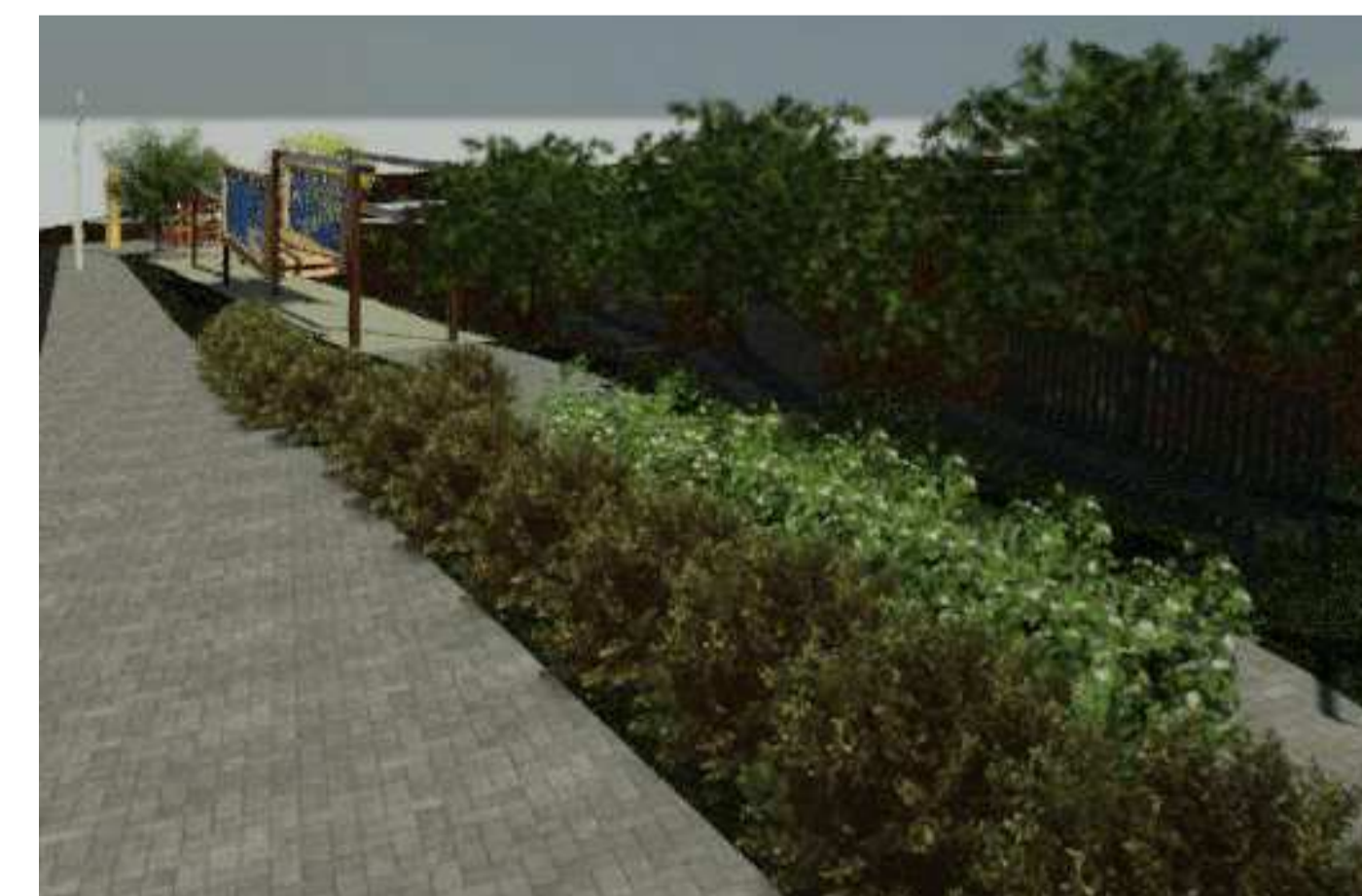
5 Renderização 3 1 : 1