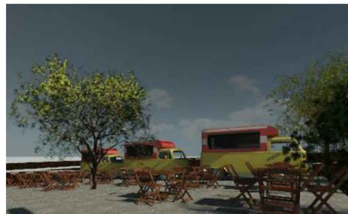
3 Renderização 1 1 : 2