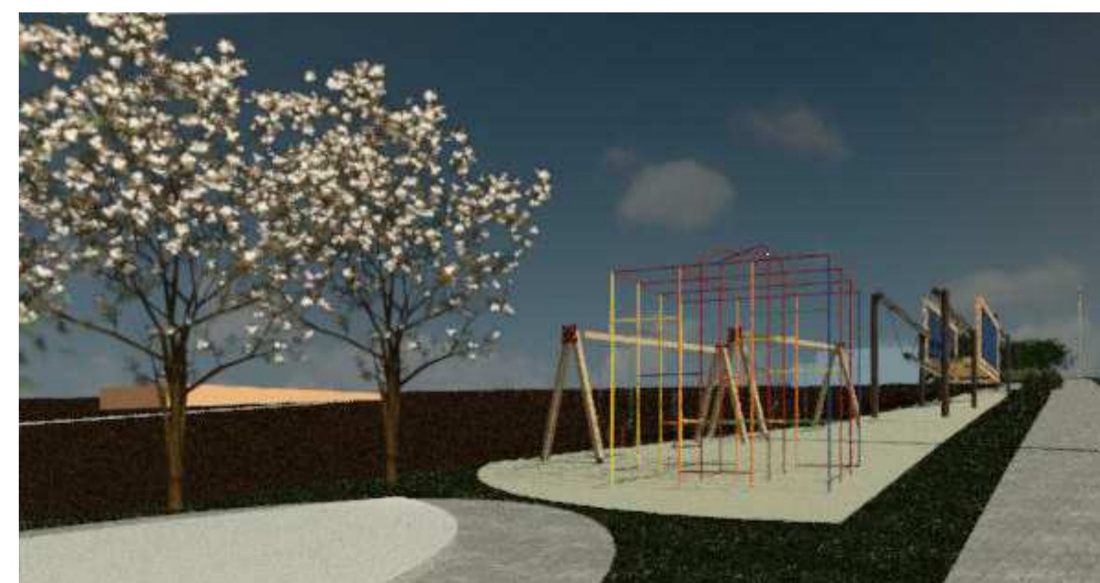
4 Renderização 2 1 : 1